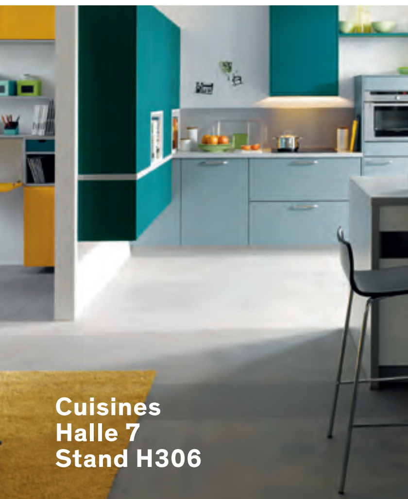
Cuisines Halle 7 Stand H306