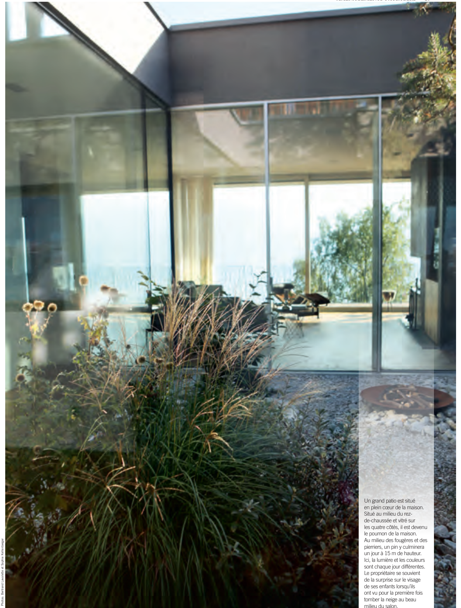
Un grand patio est situé en plein cœur de la maison. Situé au milieu du rez-de-chaussée et vitré sur les quatre côtés, il est devenu le poumon de la maison. Au milieu des fougères et des pierriers, un pin y culminera un jour à 15 m de hauteur. Ici, la lumière et les couleurs sont chaque jour différentes. Le propriétaire se souvient de la surprise sur le visage de ses enfants lorsqu'ils ont vu pour la première fois tomber la neige au beau milieu du salon.

Trois fontaines, toutes très différentes, animent le jardin. Etant reliées au système de filtration de la piscine, leurs eaux sont cristallines. Deux d'entre elles sont accompagnées du travail très organique de l'éclairagiste Jean-Philippe Weimer, lui aussi inspiré au plus près par la nature. Les paysagistes ont transformé certaines des ampoules en goulots.