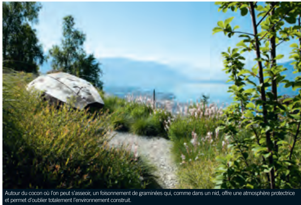
Autour du cocon où l'on peut s'asseoir, un foisonnement de graminées qui, comme dans un nid, offre une atmosphère protectrice et permet d'oublier totalement l'environnement construit.