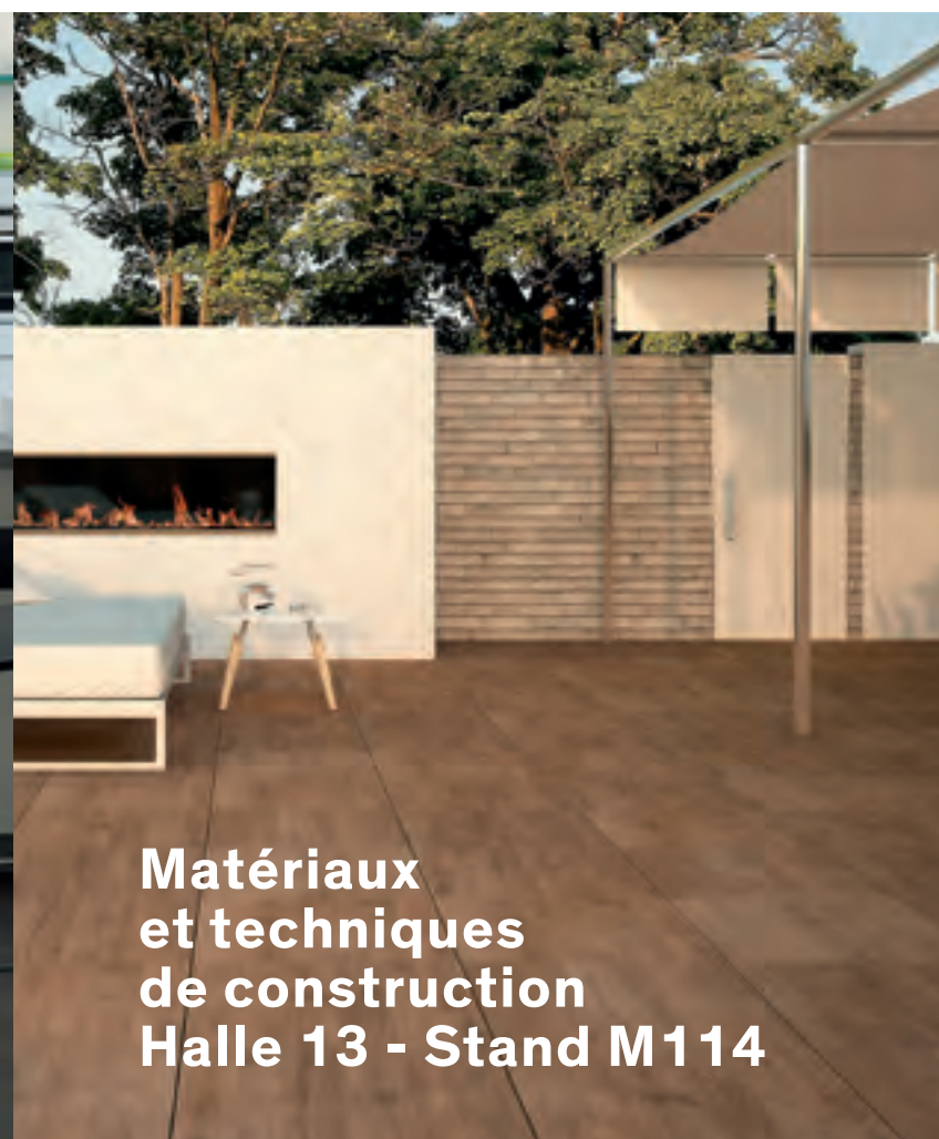
Matériaux et techniques de construction Halle 13 - Stand M114